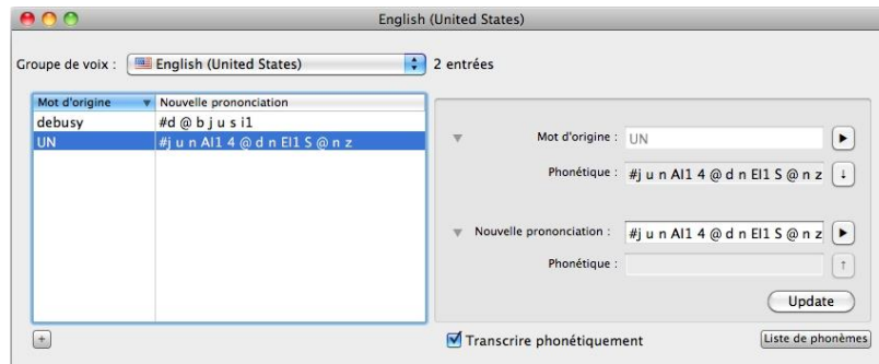
Figure 3 : Infovox iVox Pronunciation Editor.

Pronunciation Editor est un outil qui vous permet de modifier la prononciation d'un mot